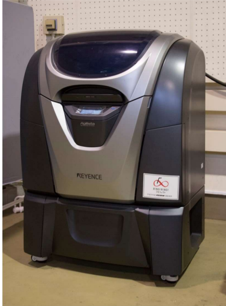
インクジェット式三次元造形機 (J) 紫外線硬化樹脂を積層しながら、切削加工では難しい複雑な形状の立体物を作り出すことができる3Dプリンターです。