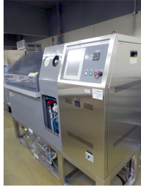
塩乾湿複合サイクル試験機試験機 (J) 中性塩水噴霧・乾燥・湿潤を組み合わせ、繰り返し試験することで、金属製品等の耐食性を迅速に評価する装置です。