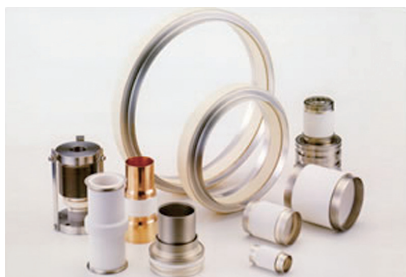
セラミックス絶縁管 (アルミナとコバルト等)