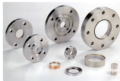
赤外線透過窓 (サファイア窓)