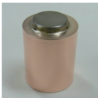
X線ターゲット (WとCuろう付品)