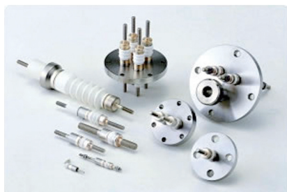
電流導入端子 (アルミナと各種金属ろう付製品)