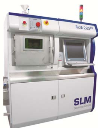
図 2 導入した金属 3D プリンタの外観