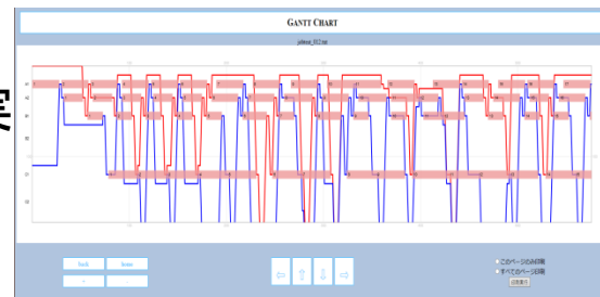
生産計画立案結果