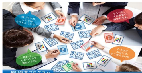
図1. グループワーク(チョイスゲーム)