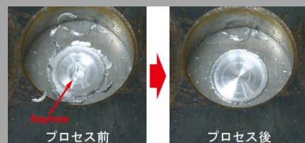
ツールを変更するだけで表面穴の 充填を行うプロセス