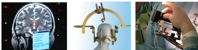
レクセルフレームを用いた治療法

このような手術をMRI画像で確認しながら手術支援アームで行うことにより、より高い安全性や手術時間の短縮が実現できる。