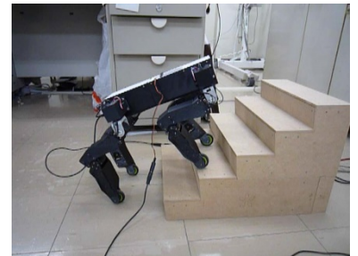
図2 樹脂3Dプリンタによる1/3小型試作機の階段上り実験