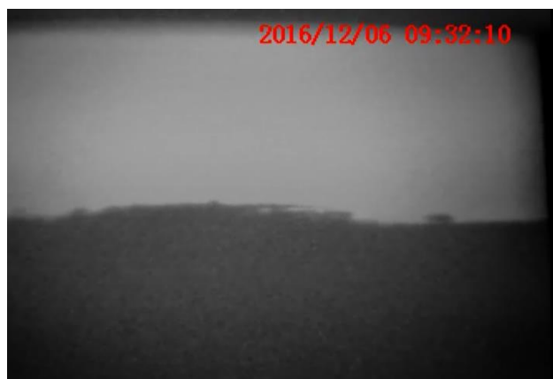
スケール付着イメージ