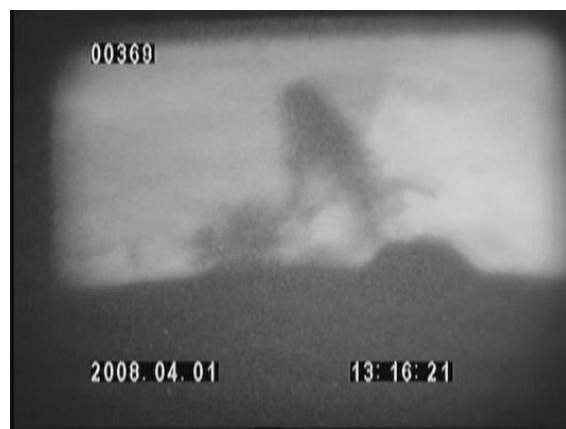
オイルリークのイメージ

現場作業を考慮して設計された、バッテリー駆動のポータブル型ライブビデオX線システムです。保温材下腐食状況確認、配管の漏洩調査等、リアルタイムに動画・静止画にて確認が可能です。