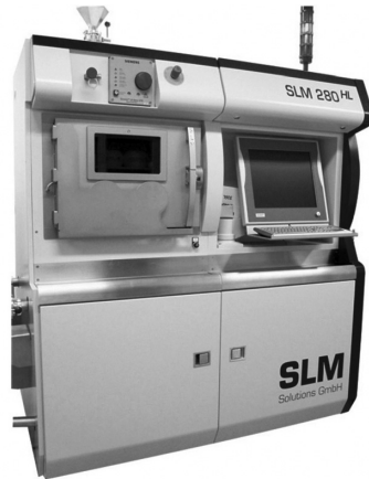
図 2. 導入した金属 3D プリンタの外観