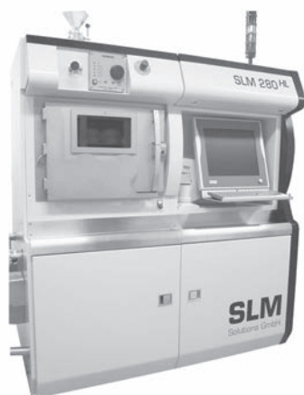
図2 導入した金属 3D プリンタの外観