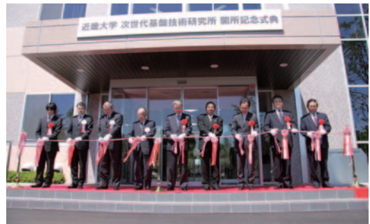
記念式典 テープカット

近畿大学工学部では、次世代基盤技術研究所を瀬戸内広域産業圏における技術開発と学术交流の拠点として位置づけ、次世代を担う基盤技術の研究開発に取り組んでまいりますので、引き続きご支援ご鞭撻のほどよろしく願いいたします。